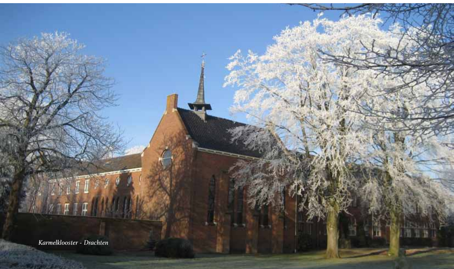
Karmelklooster - Drachten