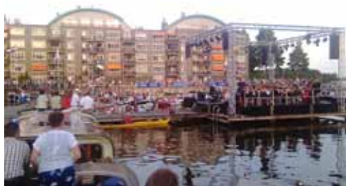
Hoornse Meer Concert 2012 Zicht op het podium